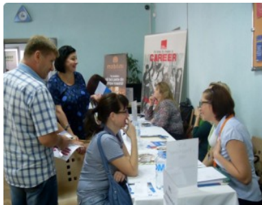
Târgul locurilor de muncă organizat de AOFM Chișinău la 23 septembrie 2013

La 23 septembrie 2015, Agenția pentru Ocuparea Forței de Muncă a municipiului Chișinău a organizat Târgul locurilor de muncă la care au participat 26 de agenți economici cu peste 400 de locuri de vacante : „Star Legal Consulting” SRL; „Vion Impex” SRL; ICS „Yopesco” SRL; „Standelev” SRL; „NeoMatrix” SRL; „Fidesco” SRL; OMF „Microinvest” SRL, etc. La eveniment a fost prezent și Centrul de instruire SYSLAB Chișinău.