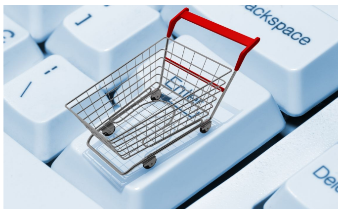
Târgul on-line „Locuri de muncă în domeniul comerțului” 23-28 septembrie 2015

dova, Camera de Comerț Americană din Moldova, Centrul Universitar de Informare și Ghidare în Carieră, Centrul de Ghidare în Carieră și Relații cu Piața Muncii și partenerii media: Pro TV Chișinău, Noroc Media, Canal Regional, portalul Civic.md, Vocea Poporului, Jurnal.md, Radiochisinau.md, Ziarulnational.md, Noi.md, Agora.md, Ipn.md, Evz.md și alții.